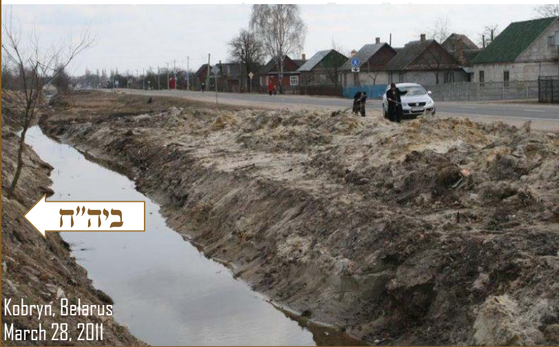
Kobryn, Belarus March 28, 2011

ביים אויסברייטערן די וואסער אפלוף פון די שטאט איז בעוה"ר צושטערט געווארן מערערע קברים ביי די גרעניץ פונ'ם ביה"ח. בילד: עסקני אבותינו אין העפטיגע ארבעט אפצושטעלן די בזיון הנפטרים וואס פריער, און דערנאך אויפשטעלן א נייעם גדר בס"ד.