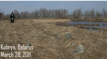
Kobryn, Belarus March 28, 2011

אייע פון די אויפגעגראבענע לעיקס אינ'ם ביה"ח. מצבות ווערן געזען דערנעבן.