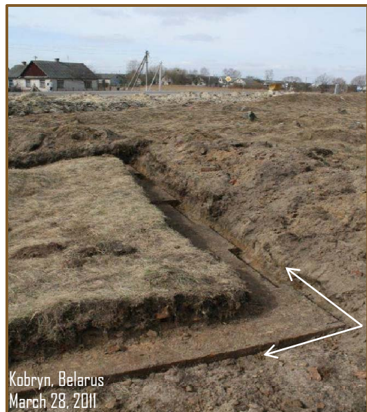
Kobryn, Belarus March 28, 2011